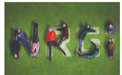
RENÉ POULSEN Netværks- og Sikkerhedsansvarlig, NRGi

” At produktet kan håndtere et bredt spektrum af opgaver, samtidig med at det er simpelt at arbejde med, har givet stor arbejdsglæde hos koncernen.